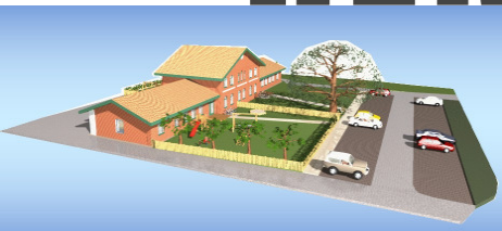
Dorferneuerung Wensin „Ideen vom Küchentisch“