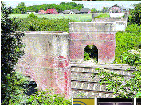
Wiederaufbau des Brücken-Überbaues Bruhnkaten